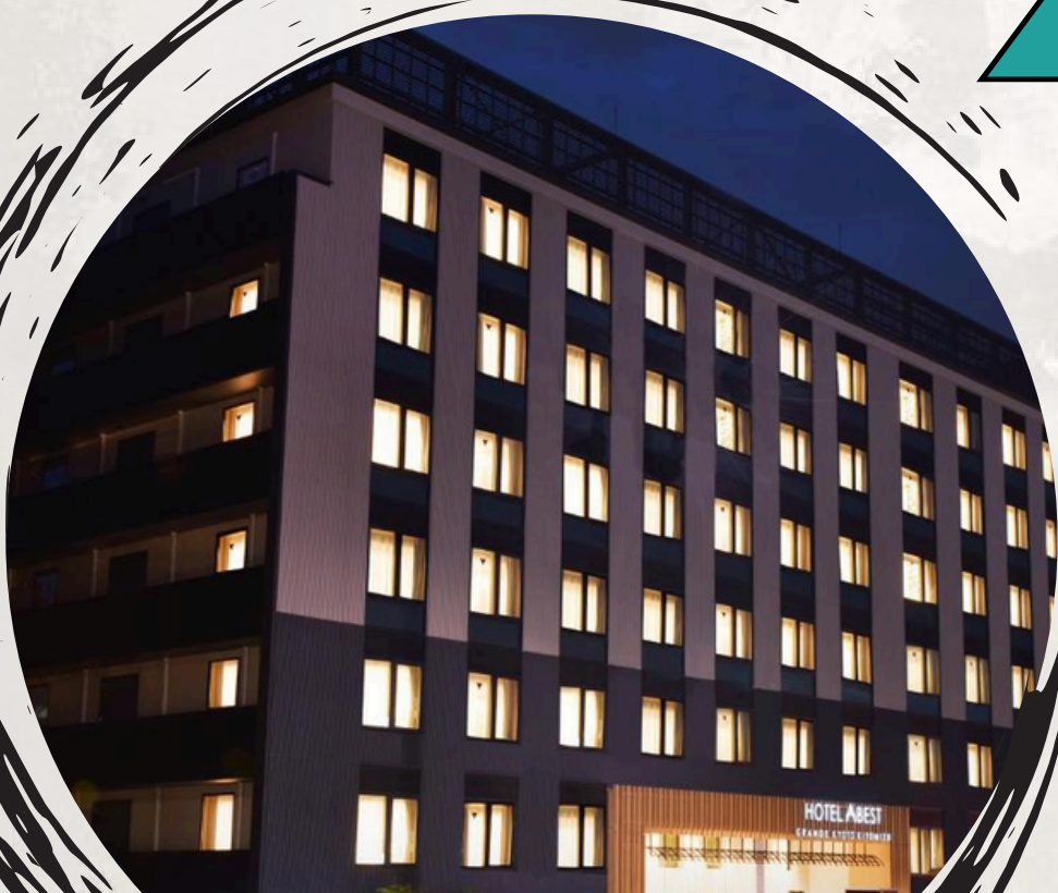
Abest Grande Kyoto