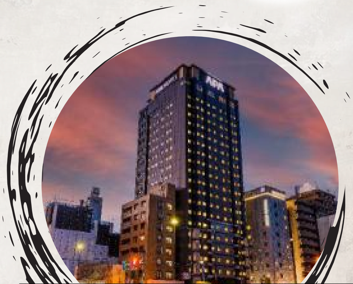
Apa Hotel Shinagawa